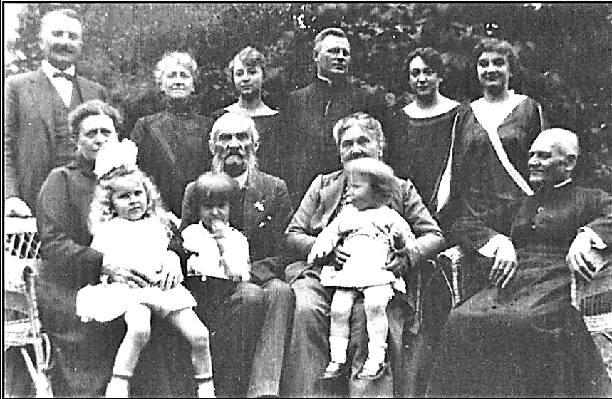
Rodzina Bojanowskich i Wrześnińskich w roku ok. 1925